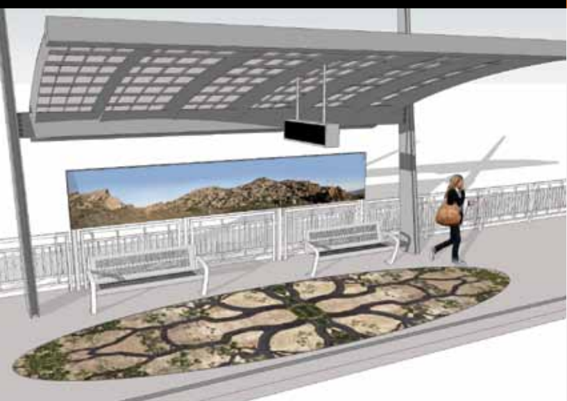
Ken Gonzales-Day, 2012 Western Imaginary

Photographs recall panoramic views of the surrounding mountains, depicting them as ideal, imagined landscapes tinged with cowboy nostalgia. Mosaic paving patterns present kaleidoscopic views of native manzanita and oak trees, inviting passengers to find shapes and faces hidden within the natural patterns.