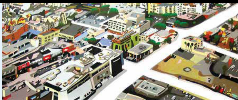
DETALLE DE 1 DE LOS 8 PANELES ARTÍSTICOS Mosaico de azulejo de cerámica pintado a mano

Las vistas aéreas de los paneles artísticos presentan un estructurado panorama de la ciudad en el que resaltan lugares emblemáticos identificables que son como las vistas que se aprecian desde esta estación elevada. Provenientes de una serie de dibujos con lápices de colores basados en fotografías del área que fueron tomadas desde un helicóptero, las imágenes que parecen retazos revelan la estructura siempre cambiante de los vecindarios cercanos.