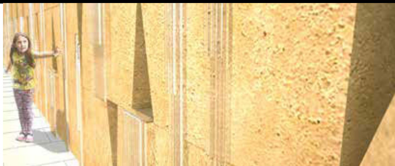
DETALLE Del diseño conceptual de las obras de arte

La obra de arte escultórica hace referencia tanto a la historia geológica como cultural de Santa Mónica a través del uso de materiales que recuerdan a la "santa que llora," a las fuentes sagradas Kuruvungna que la tribu local Tongva llamó así y a la piedra arenisca erosiva que se encuentra a lo largo de la costa de Santa Mónica.