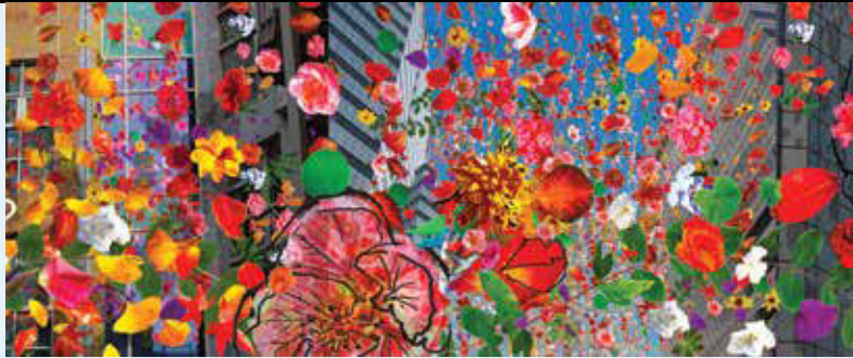
DETAIL, 1 OF 24 ART PANELS Porcelain enamel steel panels

The kaleidoscope-like compositions, inspired by walks in the area, portray various objects, plants and architecture found in the station's urban and natural surroundings. In a nod to the adjacent Bergamot Station Arts Center, the artworks also incorporate subtle art historical references, including surrealism, pop art, assemblage and performance art.