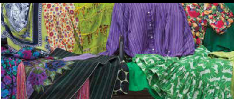
DETAIL, 1 OF 12 ART PANELS Porcelain enamel steel panels

Photographs of meticulously arranged clothing culled from community members represent both the commuter and the rhythm of the daily commute. Shown pressed together in closets, the garments symbolize rush hour, whereas when depicted draped over benches, they create the impression of waiting seated figures. Overall, the clothes showcase diverse personalities, professions and cultural influences.