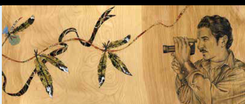
DETALLE DE 1 DE LOS 10 PANELES ARTÍSTICOS Azulejo de cerámica pintado a mano, mosaico de vidrio y vidrio fundido

Las obras de arte rinden homenaje a la historia cultural del área al retratar su paisaje y demografía cambiantes. Se retratan dibujos a lápiz de la vida de las personas y de las plantas de la comunidad con incrustaciones de mosaico estampado de papel washi mezclado en un fondo de madera: materiales que hacen referencia a la herencia japonesa del artista y del vecindario.