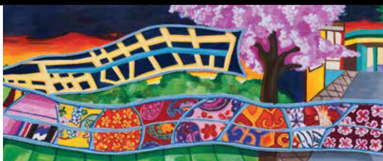
DETALLE DE 1 DE LOS 8 PANELES ARTÍSTICOS Cerámica pintada a mano, mosaico de vidrio y vidrio fundido

El paisaje urbano local de nuestros días y su pasado agrario se ilustran en los paneles artísticos de mosaico. Una franja de nubes que une las escenas exhibe patrones textiles de una variedad de tradiciones culturales unidas con hilo azul en forma de edredón que hacen referencia a la Expo Line en un lado y a una abstracción del mapa del área que delinea la ruta del metro del otro.