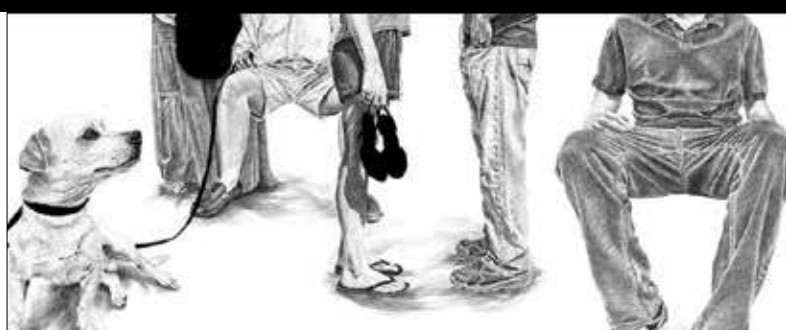
DETALLE DE 1 DE LOS 12 PANELES ARTÍSTICOS Paneles de acero porcelanizado

Los dibujos que se presentan en los paneles artísticos retratan a los pasajeros apresurándose a sus destinos o esperando tranquilamente: desde ejecutivos y padres, hasta un jardinero y un militar discapacitado. Las imágenes hacen referencia a los lugares emblemáticos y a la historia del área, como el Hogar para Veteranos de Sawtelle (Sawtelle Veterans Home), Little Osaka y los viveros que alguna vez abundaron.