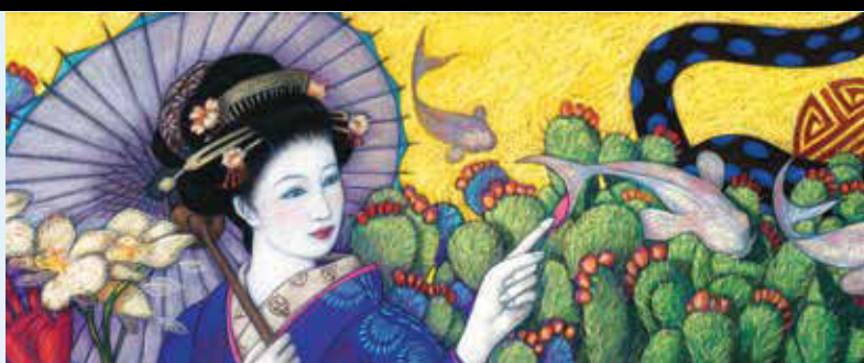
DETAIL, 1 OF 24 ART PANELS Glass mosaic

A composite of global mythologies are layered within the mosaic artworks at this terminus station located at the edge of the continent. Various cultural identifiers and allusions to the passage of time create a sense of shared place and historical significance that honors the heritage of the local, the immigrant and the tourist alike.