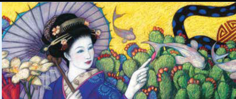
DETALLE DE 1 DE LOS 24 PANELES ARTÍSTICOS Mosaico de vidrio

Un compuesto de mitologías globales se pone en capas entre las obras de arte de mosaico en esta estación terminal ubicada en el límite del continente. Varios identificadores culturales y alusiones al paso del tiempo crean una sensación de espacio compartido y de trascendencia histórica que rinde homenaje a la herencia del nativo, del inmigrante y del turista por igual.