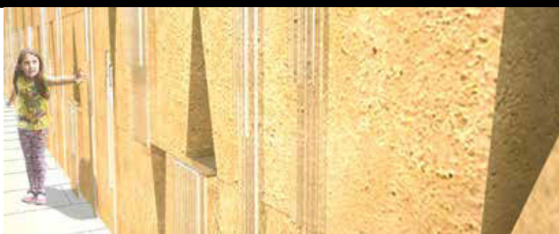
DETAIL Artwork concept design

The sculptural artwork references both the geological and cultural history of Santa Monica through the use of materials that recall Saint Monica, the "weeping saint," the sacred springs named Kuruvungna by the local Tongva tribe and the eroding sandstone along the Santa Monica coastline.