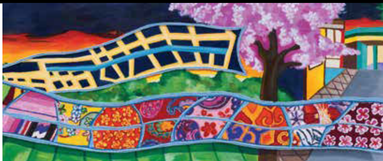
DETAIL, 1 OF 8 ART PANELS Hand-painted ceramic, glass mosaic and fused glass

The local present-day urban landscape and its agricultural past are illustrated on the mosaic art panels. A billowing sash uniting the scenes features textile patterns from a range of cultural traditions quilted together with a blue yarn in reference to the Expo Line on one side, and an abstracted area map delineating the route of the railway on the other side.